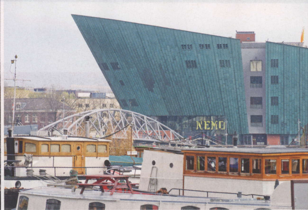
ronde suikerbroden; op de Zeedijk; de bijnaam van de Montelbaanstoren is Malle Jaap; uitzicht op kindermuseum Nemo vanaf de Prins Hendrikkade.