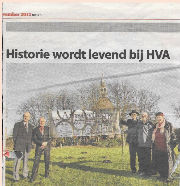
Het bestuur van de Historische Vereniging Amsterdam-voor de Buiksloterkerk.

De vereniging werd opgericht op 1 juli 2012. In de ALV van 11 februari 2014 werd besloten de statuten op te nemen in een notariële akte. Op 4 maart 2014 is de oprichtingsakte bij de notaris getekend.